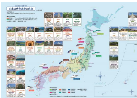
日本の世界遺産の地図