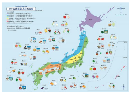
おもな特産物・名所の地図